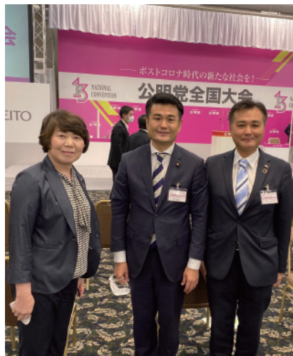
地元議員と決意も新たに

(発行元) 河野義博後援会 〒810-0045 福岡市中央区草香江1-4-34 エーデル大豪202号 TEL 092-753-6491 FAX 092-753-6492