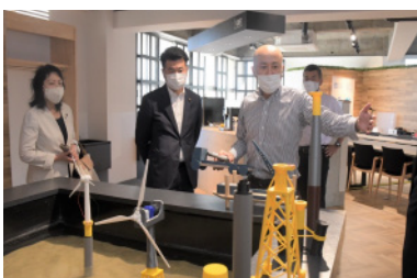
押ししていきます。

同拠点は、日本財団や長崎県、長崎大学等が協同で創設したもので、洋上風力発電などに関する講習を開始します。先駆的な取り組みを後