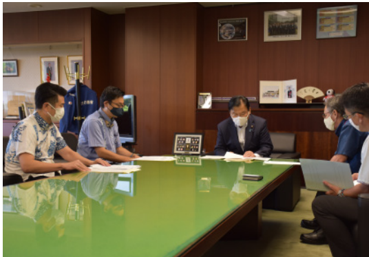
赤羽大臣と説明を聞く