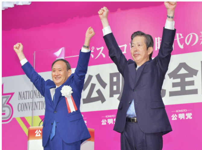
協力を誓い合う山口代表と菅総理