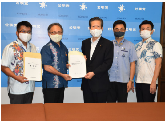
山口代表と要望を受ける

表と首里城公園を訪問。再建計画について、関係者と意見交換しました【写真】。段階的な復元工事を一般公開している「見せる復興」大事な観光資源になります。二〇二六年の復元をめざし、円滑な再建を後押ししてまいります。