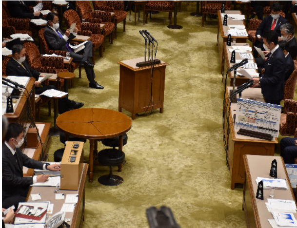
予算委員会で菅総理に質問する

私がライフワークとして取り組む再生可能エネルギーの普及・拡大が、大きく前進します。経済産業省は、昨年末、二〇五