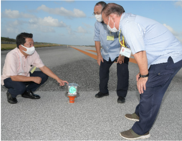
南大東空港の滑走路を視察する議員ら