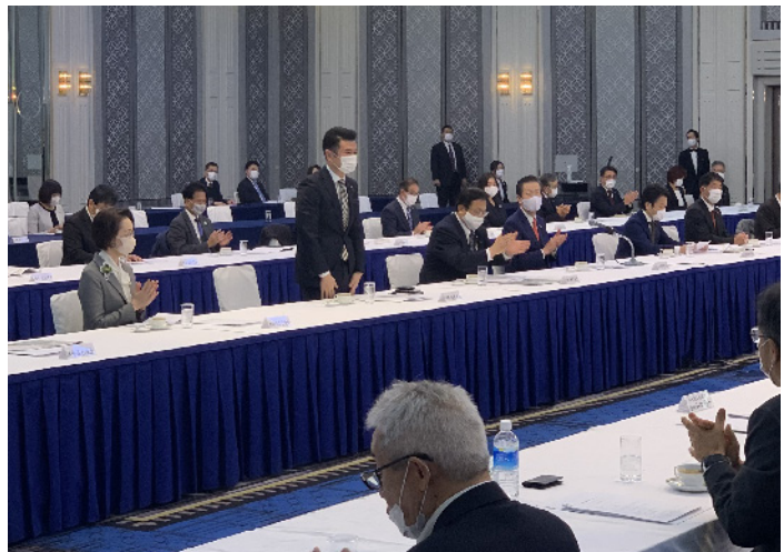
商工会議所との懇談会で挨拶