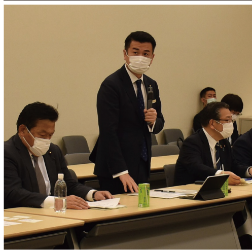
合同会議で関係団体との意見交換

政府のクリーンエネルギー戦略策定に対する党としての提言を取りまとめるにあたり、私が事務局長を務める党地球温暖化対策本部と総合エネルギー対策本部との合同会議において、関係団体、企業そして自治体との意見交換を活発に行いました。カーボンニュートラルの実現に向けた取り組みに活発な議論がなされ、様々なご要望を聴取させていただきました。政府方針に反映させるべく、提言を取りまとめます。