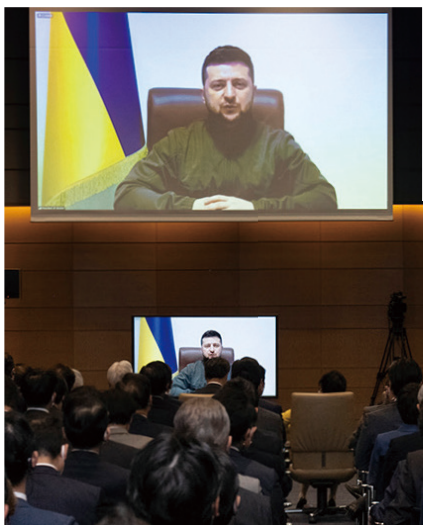
ゼレンスキー大統領 国会オンライン演説

ウクライナのゼレンスキー大統領が国会で憲政史上初めてのオンライン演説を行いました。大統領は、アジア圏内で初めてロシアに圧力をかけたのが日本と評価した上で、制裁の継続を要請。日本に対する様々な配慮を織り交ぜた戦地からの悲痛な叫びに、心を打たれました。