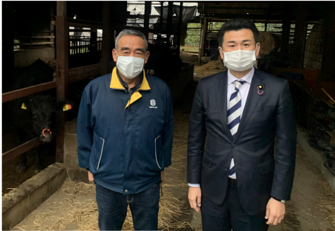
模範的な和牛農家の経営状況を視察

地元の福岡市西区の博多和牛農家「堀ちゃん牧場」は、和牛の繁殖から肥育まで一貫生産をされており、飼料となる牧草の飼育も手掛け、粗飼料自給率は150パーセントを達成。精肉小売