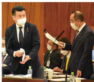
特別委員会にて西銘大臣へ質問